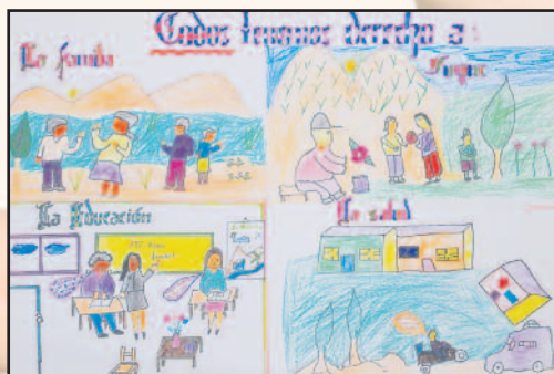
Maison de l'Enfance Unidad Educativa Mahamota (Potosi - Bolivie) Lauréate "Agis pour les droits" 2007