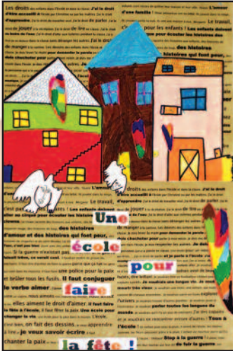
Ecole publique de Bieuvy-les-eaux Lauréat "Agis pour tes droits" 2005

Comme chaque année dans ma classe, on travaille sur les droits des enfants dans l'école et dans la classe. Les mots des enfants ne sont jamais les mêmes et il n'y a guère de routine dans ce travail. C'est ainsi que les droits et les devoirs des enfants s'affichent, un autre travail commence, celui qui fera que ces mots, écrits ensemble, prendront vie concrètement. Vivre ses droits au quotidien, ce n'est pas simple, il faut apprendre ensemble.